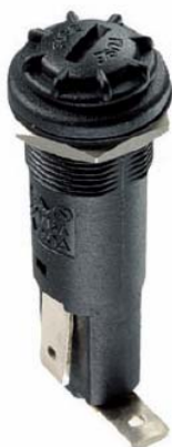
Foto e disegno (dimensioni in mm) / Product image and drawing (dimensions in mm)